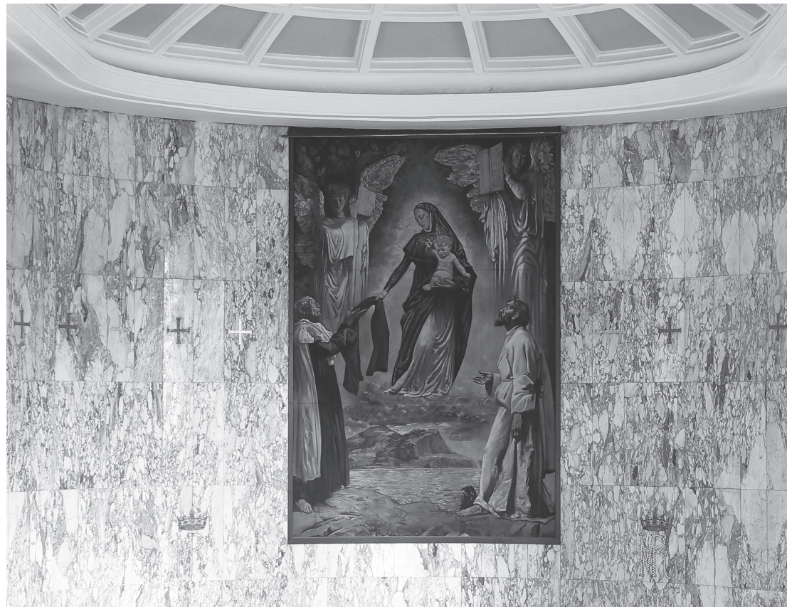
Obraz na čelní stěně kaple karmelitánského kláštera v irském Dublinu.

svém vzniku byli poustevníci na Karmelu nazýváni bratry Blahoslavené Marie z hory Karmel, ale skutečného významu nabyl tento titul až ve 20. století v souvislosti s Druhým vatikánským koncillem, když papež Pavel VI. při posledním zasedání třetí zasedací perrody 21. listopadu 1964 zdůraznil: „ Maria je nám velmi blízko. Je Adamovou dcerou jako my, a proto naši sestrou skrze pouto přirozenosti. Je samozřejmě tvorem, který však byl uchráněn dědičné viny s ohledem na zásluhy Vykupitele. K obdržným darům milosti připojila osobní ctnost bezvýhradné přikladné víry. “