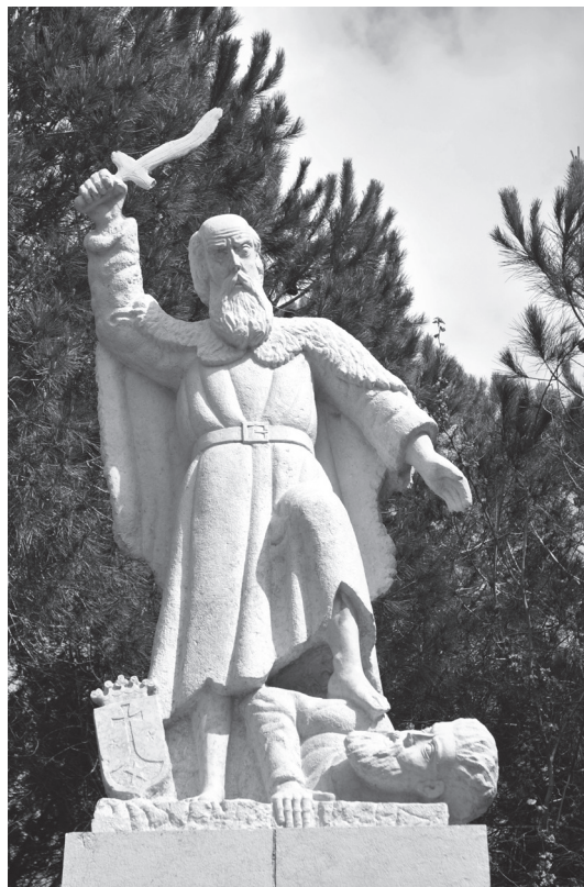
Socha proroka Eliáše v městě Muhraka ve Svaté zemi, kde se podle tradice odehrála Eliášova oběť (1 Král 18).

Dalším Eliášovým slovem, které utváří karmelitánskou spiritualitu, je výrok: „ Zelo zelatus sum pro Domino Deo exercituum “. 14 Tato slo-