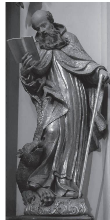
Socha proroka Elizea na hlavním oltáři pražského kostela sv. Havla. V návaznosti na úryvek 2 Král 2,23-25 patří mezi typické atributy tohoto proroka mj. medvěd a pleš.

je místo, kudy se Syřané chystají na izraelské území vpadnout. Syrský král zjistí, že Izraelci jsou schopni se připravit na jeho útoky nikoli díky svým vyzvědačům, ale díky poznání, jehož se dostává Božímu proroku. Rozhodne se proto Elizea zajmout a oblehne město Dótan, v němž se někdejší Eliášův žák zdržuje. Ustrašený sluha Géchází příběhne k Elizeovi se zprávou, že jsou obleženi nepřátelskou přesilou; Elizeus mu nejprve modlitbou otevře zrak, aby byl schopen vidět neviditelnou jízdu a ohnivé vozy, kterak Elizea brání, a zbaví tak mládence strachu. Posléze se pomodlí, aby Hospodin Syřany ranil zaslepeností, a slepé je dovede do Samaří, hlavního města severního Izraele, kde se jim oči znovu otevřou. Izraelský král se nato proroka ptá, zda má nepřátele pobít, proti tomu se ale Elizeus ohrazuje: izraelský král je přece nezajal vlastní mocí, takže mu jejich život nenáleží. Vyžádá si proto na králi, aby pro ně připravil hostinu a propustil je domů.