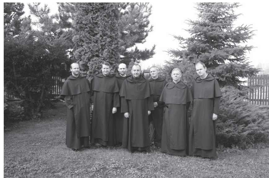
Oba vizitující na společné fotografii s libockou komunitou.

Bratři si mají uvědomit, že takto je vizitátor zapřísahá, tzn. jeho slovo je váže jako přísaha. Pokud by něco, co má být vyjeveno, neoznámili, dopouštějí se porušení přísahy.